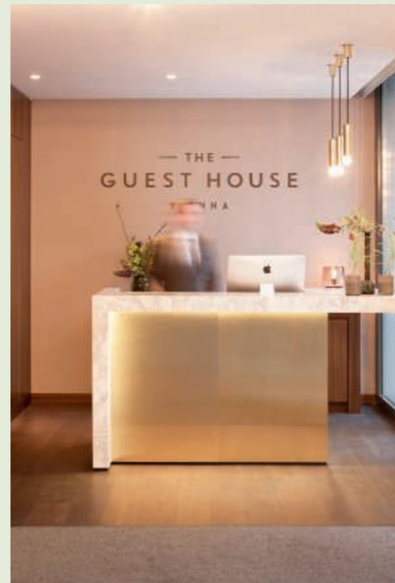
The Guesthouse Vienna

JP Hospitality realisiert und managt herausragende Hotelimmobilien in den bekanntesten und beliebtesten Städten und Regionen Europas. Dabei legen wir größten Wert auf die Schaffung ökonomisch und ökologisch nachhaltiger Projekte mit großem Entwicklungspotential und hoher Rendite. Ganz gleich, ob Sie Investor, Verkäufer oder Käufer einer Hotelimmobilie sind, wir bieten Ihnen in der Zusammenarbeit mit JP Hospitality Kompetenz, Knowhow, Professionalität und Engagement.