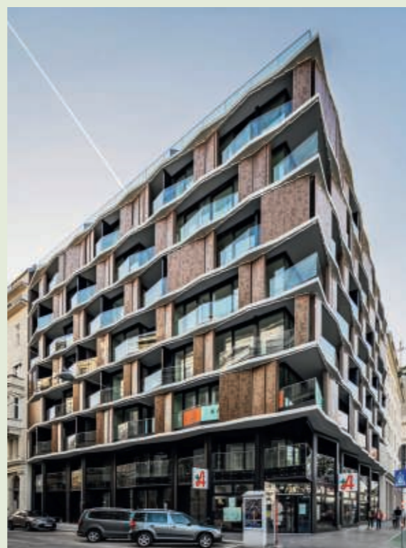
Kayser, Franz-Josefs-Kai 51, 1010 Wien

Seit 1996 ist die JP Immobilien Gruppe als Developer/Bauträger im frei finanzierten Bereich tätig und errichtet jährlich zwischen 200 und 500 Wohnungen, Hotels sowie Gewerbeobjekte in Wien.