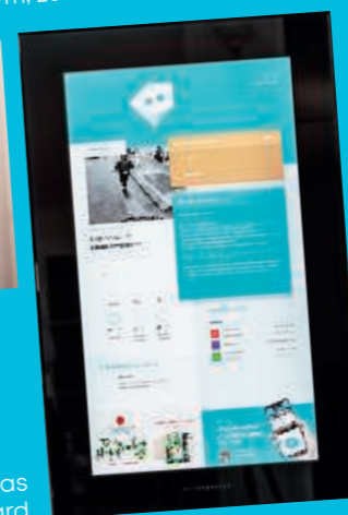
Das puck Board