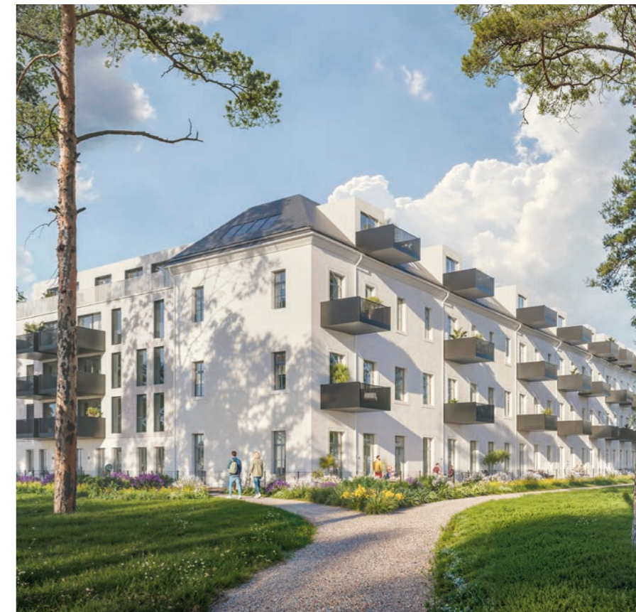
Stadt-Land-Berg-Wohnungen, 1210 Wien Vienna Eine historische Liegenschaft mit 49 hoch- modernen Alt- und Neubauwohnungen am Fuße des Bisambergs. A historic property with 49 state-of-the-art prewar and newly built apartments at the foot of Bisamberg.