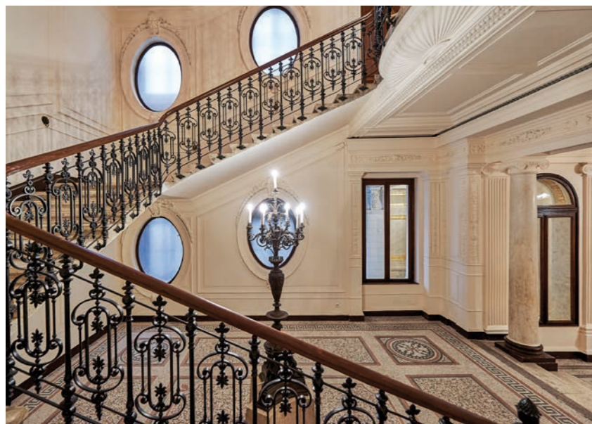
Weihburggasse 26, 1010 Wien Vienna Ein behutsam revitalisierter Jahrhun- dertwendebau, der Raum für zeitlos stilvolles Leben schafft. A meticulously restored turn-of-the- century property designed for timeless, sophisticated living.