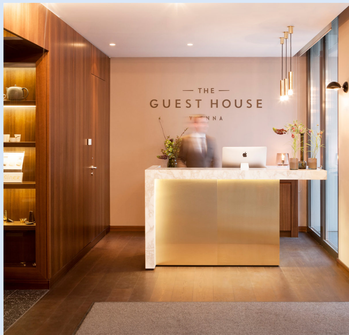
The Guest House, 1010 Wien

Hotels können viele Herausforderungen mit sich bringen: Investitionsstau, fehlende Nachfolge oder zu wenig Personal – und manchmal all das zur gleichen Zeit. JP Hospitality meistert diese Herausforderungen für Sie, denn wir realisieren und managen herausragende Hotelimmobilien in den bekanntesten und beliebtesten Städten und Regionen Europas.