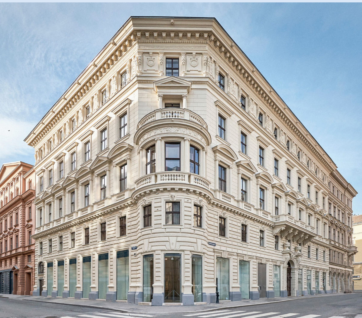
Weihburggasse 26, 1010 Wien

Sie haben eine Altbauwohnung oder ein ganzes Zinshaus – wir haben langjährige Erfahrung, von der Sie sofort profitieren. Ihre Immobilie ist bei uns garantiert in besten Händen, denn wir verfügen über ein starkes Portfolio mit einer Gesamtfläche von derzeit 250.000 m 2 .