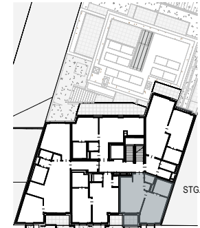
Ottakringer Straße 26