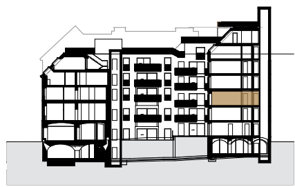
TOP 11 Stiege 3 2. OBERGESCHOSS 2 Zimmer