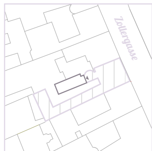
Top 01 49,23 m 2